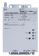
高速同軸線モデム (親機) ECG12M1