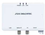
高速同軸線モデム (子機) ECG12T1