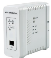
無線LAN付 高速同軸線モデム(子機) ECG12W1S