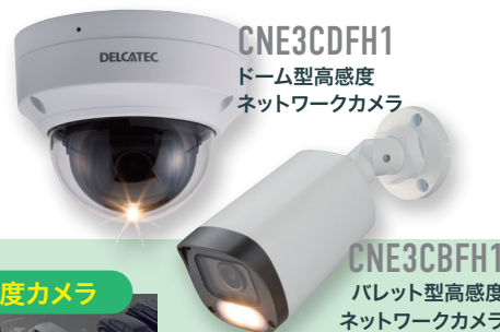
CNE3CDFH1 ドーム型高感度 ネットワークカメラ