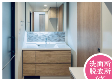
洗面所 脱衣所 など