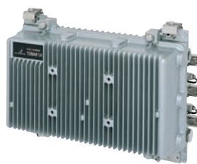
幹線分岐増幅器 TDBA8134 ※TDA/TBA機能切替式